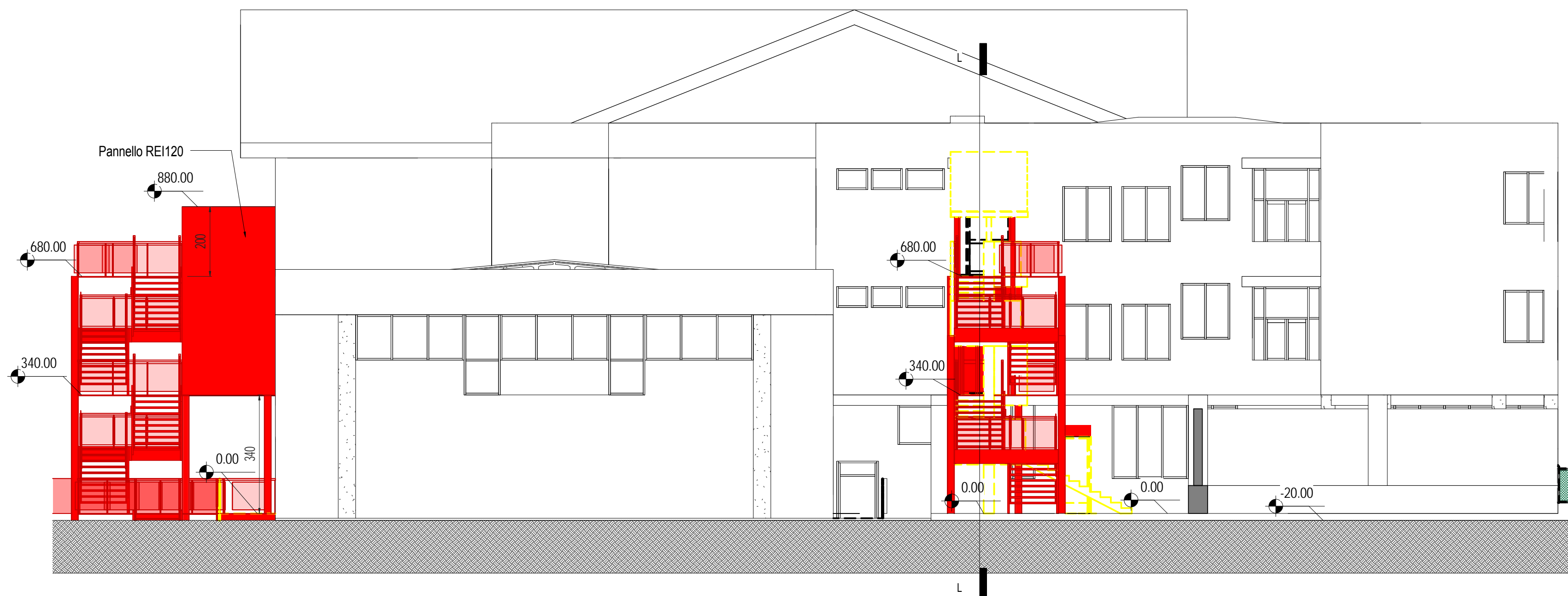
1 Prospetto Nord 1 : 100