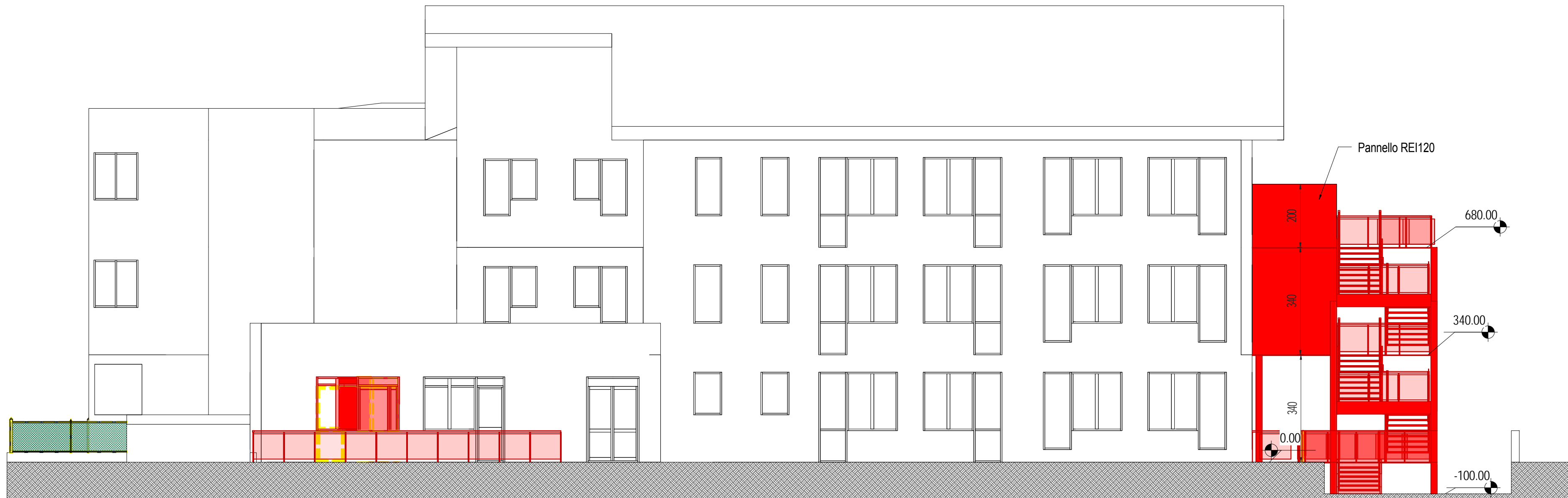
3 Prospetto Sud 1 : 100